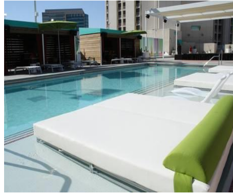
Golden Nugget Hotel Las Vegas https://www.goldennugget.com/las-vegas/